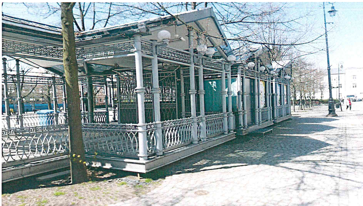
Ogródek kawiarniany – pow. 90,11 m 2