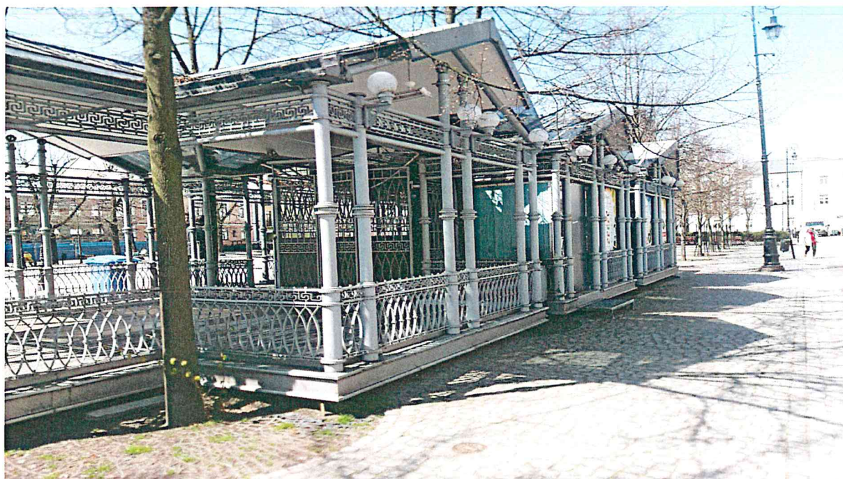
Ogródek kawiarniany – pow. 90,11 m 2